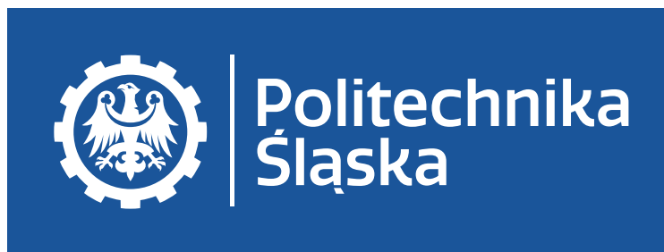
LOGO w języku polskim w kontrze