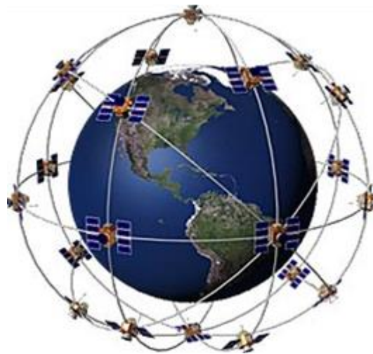
Rys. 5. Segment satelitarny systemu GPS NAVSTAR

Działanie systemu jest oparte na wyznaczaniu odległości między odbiornikiem a satelitami. Wyznaczenie położenia odbiornika w przestrzeni wymaga więc odbioru z minimum trzech satelitów (wymagane są cztery). Satelity GPS emitują dwa sygnały: kod C/A (Coarse Acquisition, częstotliwość L1 = 1575,42 MHz) dla użytkowników SPS i kod P dla PPS (Precise, L2 = 1227,6 MHz) dla zastosowań wojskowych. GPS przewiduje dwa poziomy dokładności: PPS (Precise Positioning System) – dokładny serwis nawigacyjny i SPS (Standard Positioning System) – standardowy serwis nawigacyjny.