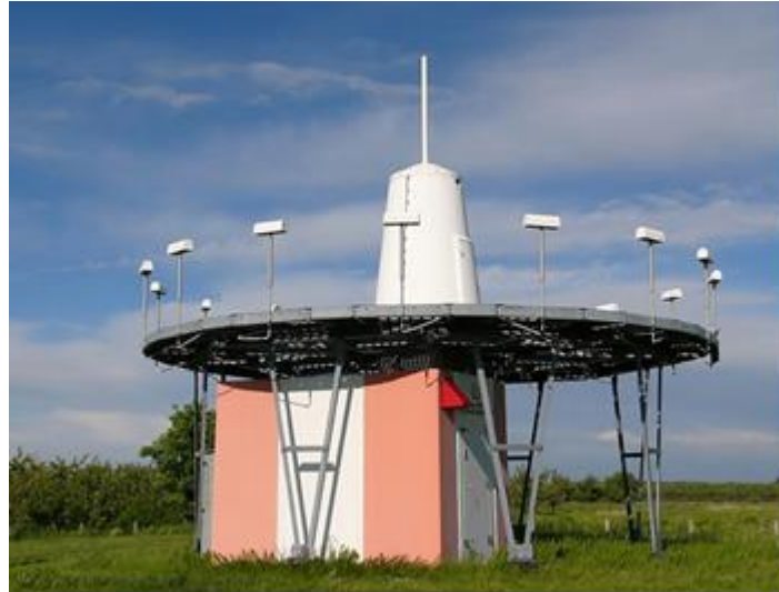
Rys. 2. Typowa radiolatarnia VOR

Radiolatarnie VOR pracują zasadniczo w zakresie od 112 do 117.9 MHz (co 100 kHz). Dopuszcza się wykorzystanie częstotliwości od 108 do 112 MHz, z odstępem 200 kHz (tzn. 112.0; 112.2; 112.4 itd). Moc wyjściowa radiolatarni VOR wynosi od 100 do 200 W. Radiolatarnie VOR o mocy zmniejszonej do 50 W, tzw. T-VOR (Terminal VOR) są przeznaczone do instalowania na obszarach dużego zagęszczenia pomocy radionawigacyjnych, np. w okolicy portów lotniczych. Odmianą VOR jest tzw. D-VOR (Doppler-VOR), w dużym stopniu odporny na wpływ przeszkód terenowych. Pomimo odmiennej zasady pracy radiolatarni jest całkowicie kompatybilny z klasycznymi odbiornikami. Na lotniskach czasem spotyka się radiolatarnie testowe, nazywane VOT (VHF Omnidirectional Test facility), służące do kontroli i kalibracji pokładowych zestawów VOR. VOT mają moc wyjściową nie większą niż 5 W. Pracują na częstotliwościach 108.0 i 108.05 MHz.