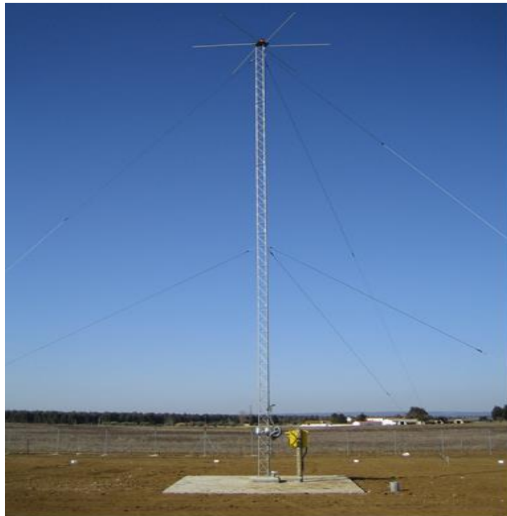
Rys. 1. Trasowa radiolatarnia NDB

Odbiornik pokładowy systemu NDB, czyli radiokompas (ADF – Automatic Direction Finder), po dostrojeniu do częstotliwości radiolatarni wskazuje kąt kursowy na radiolatarnię NDB z dokładnością \pm 6,9^\circ . Zakres częstotliwości odbiornika wynosi od 150 do 1750 kHz – jest rozszerzony w stosunku do typowego zakresu NDB dla zachowania możliwości namierzania publicznych radiostacji średniofalowych.