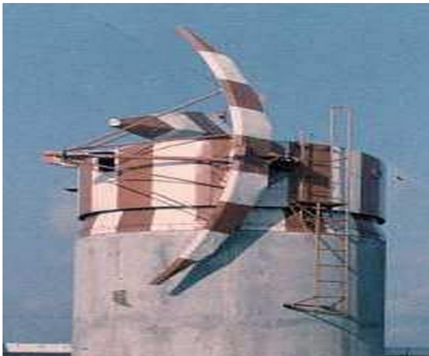
Rys. 7. Approach Radar