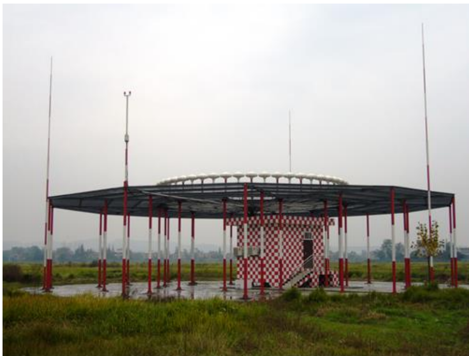
Rys. 3. Radiolatarnia D-VOR

Radiolatarnie VOR pracują zasadniczo w zakresie od 112 do 117.9 MHz (co 100 kHz). Dopuszcza się wykorzystanie częstotliwości od 108 do 112 MHz, z odstępem 200 kHz (tzn. 112.0; 112.2; 112.4 itd). Moc wyjściowa radiolatarni VOR wynosi od 100 do 200 W. Radiolatarnie VOR o mocy zmniejszonej do 50 W, tzw. T-VOR (Terminal VOR) są przeznaczone do instalowania na obszarach dużego zagęszczenia pomocy radionawigacyjnych, np. w okolicy portów lotniczych. Odmianą VOR jest tzw. D-VOR (Doppler-VOR), w dużym stopniu odporny na wpływ przeszkód terenowych. Pomimo odmiennej zasady pracy radiolatarni jest całkowicie kompatybilny z klasycznymi odbiornikami. Na lotniskach czasem spotyka się radiolatarnie testowe, nazywane VOT (VHF Omnidirectional Test facility), służące do kontroli i kalibracji pokładowych zestawów VOR. VOT mają moc wyjściową nie większą niż 5 W. Pracują na częstotliwościach 108.0 i 108.05 MHz.