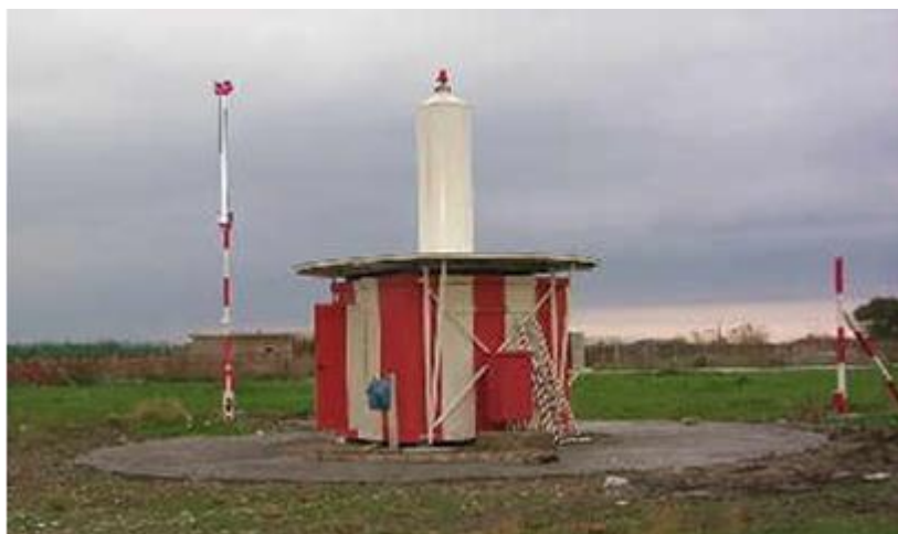
Rys. 4. Radiolatarnia VOR/DME z anteną DME

DME pracuje na zasadzie odzewowej; pomiar odległości w urządzeniu pokładowym odbywa się na podstawie zliczenia czasu od wysłania impulsów zapytania do otrzymania odpowiedzi od naziemnej radiolatarni VOR/DME.