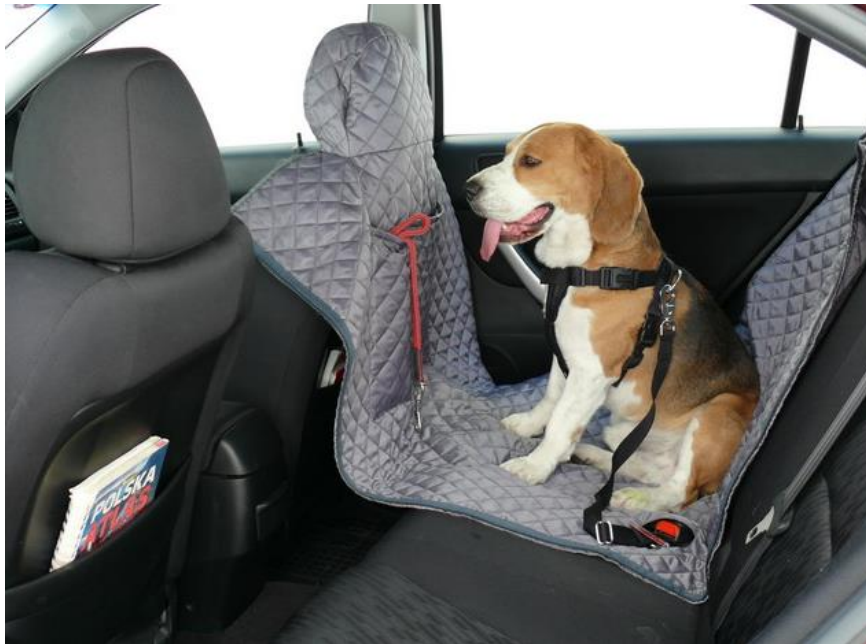
Rys. 11. Mocowanie szelek transportowych [14]

W przypadku transporterów i klatek umieszczanych w bagażniku pojazdu istotne jest dopasowanie ich do przestrzeni ładunkowej w taki sposób, aby nie przemieszczały się one w trakcie transportu. Natomiast umieszczając psa w samochodzie wyposażonym w kratkę oddzielającą przestrzeń ładunkową, należy pamiętać o tym, by sam czworonóg był odpowiednio zabezpieczony, np. szelkami transportowymi, by nie przemieszczał się w bagażniku (rys. 12).