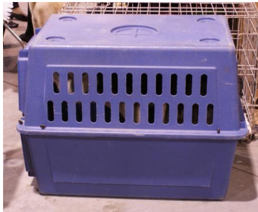
Rys. 4. Transporter „sztywny” przeznaczony dla małych psów i kotów. Zdjęcie wykonane podczas Zimowej Krajowej Wystawy Psów Rasowych Sosnowiec 18.01.2015