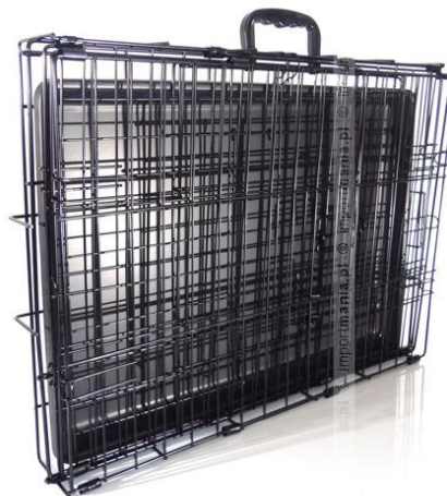
Rys. 6. Składana klatka dla psów – funkcjonalność [8]