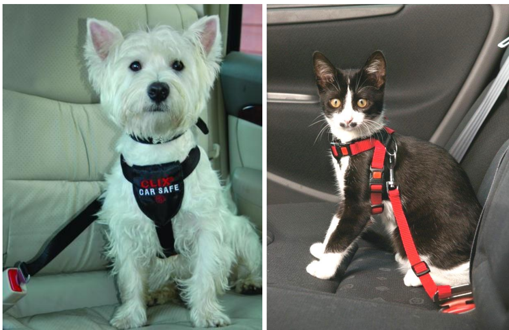
Rys. 8. Szelki transportowe dla psów i kotów [9 ,10]

Jeżeli właścicielom czworonogów nie zależy na ich przenoszeniu za pomocą transportera, klatki czy torby, mogą skorzystać z szelek transportowych (rys. 8). Taka forma zabezpieczenia wymaga jednak zastosowania dodatkowej ochrony siedzeń, by poruszający się pies/kot nie uszkodził tapicerki (np. przez zastosowanie dodatkowej maty ochronnej).