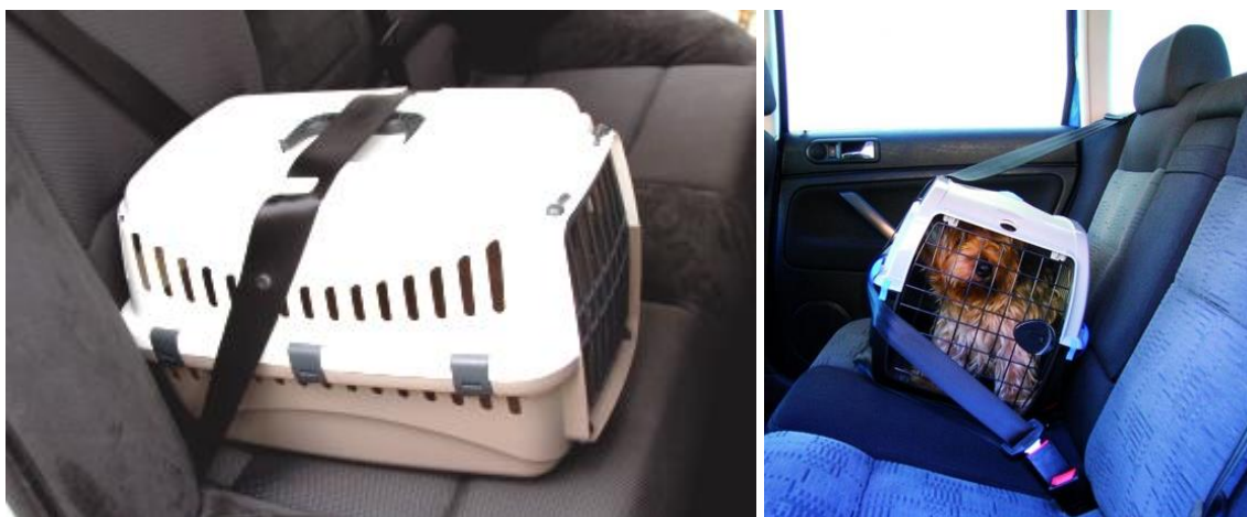
Rys. 10. Sposoby mocowania transporterów sztywnych [12, 13]