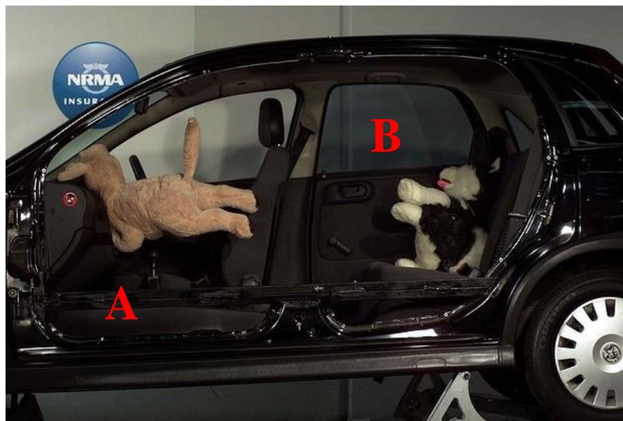
Rys. 1. Pies podczas crash testu: A – przewożony bez zabezpieczenia, B – przewożony z zabezpieczeniem [6]

Mimo że ustawa Prawo o ruchu drogowym (DzU 1997, nr 98, poz. 602) [1] nie stanowi wprost o przewozach zwierząt w pojeździe, istnieją jednak przepisy, które wymagają od kierowców zachowania szczególnego bezpieczeństwa, mianowicie [2, 3]: