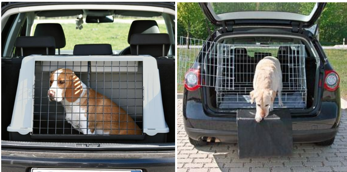
Rys. 12. Sposób umieszczenia transportera oraz klatki w bagażniku pojazdu [15, 16]

W przypadku transporterów i klatek umieszczanych w bagażniku pojazdu istotne jest dopasowanie ich do przestrzeni ładunkowej w taki sposób, aby nie przemieszczały się one w trakcie transportu. Natomiast umieszczając psa w samochodzie wyposażonym w kratkę oddzielającą przestrzeń ładunkową, należy pamiętać o tym, by sam czworonóg był odpowiednio zabezpieczony, np. szelkami transportowymi, by nie przemieszczał się w bagażniku (rys. 12).