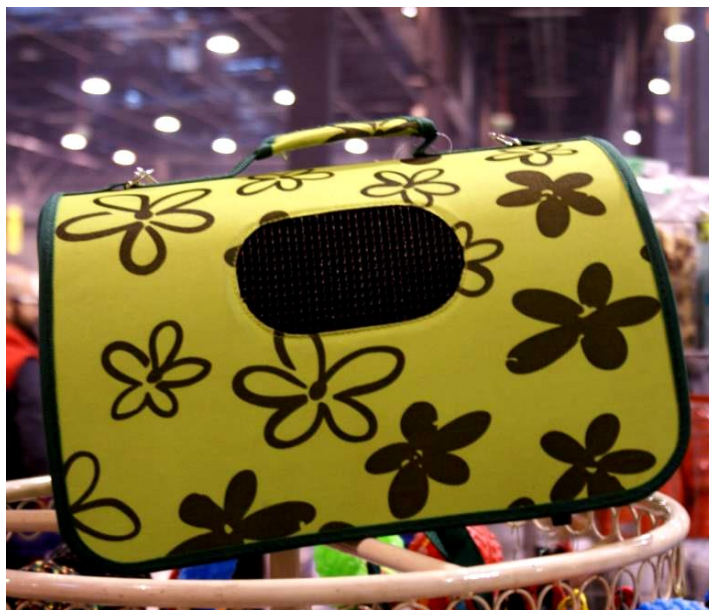
Rys. 7. Torba transportowa dla psów i kotów. Zdjęcie wykonane podczas Zimowej Krajowej Wystawy Psów Rasowych Sosnowiec 18.01.2015