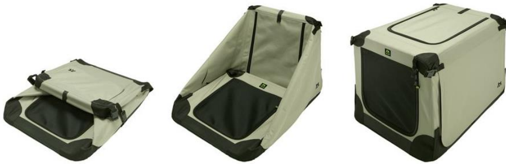
Rys. 3. Transporter „miękki” składany typu torba – funkcjonalność [7]