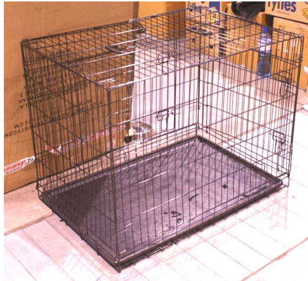
Rys. 5. Składana klatka dla psów. Zdjęcie wykonane podczas Zimowej Krajowej Wystawy Psów Rasowych Sosnowiec 18.01.2015.