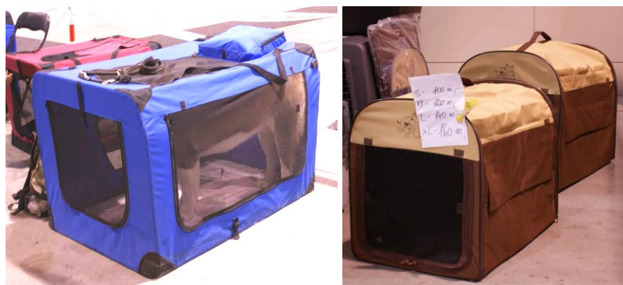
Rys. 2. Transportery „miękkie” przeznaczone dla psów. Zdjęcia wykonane podczas Zimowej Krajowej Wystawy Psów Rasowych Sosnowiec 18.01.2015

Wyróżniamy dwa rodzaje transporterów: transportery „stałe” (sztywne), bez możliwości ich złożenia, kiedy nie przewozimy zwierzęcia, oraz transportery „miękkie” – składane, w formie torby. Tego rodzaju zabezpieczenia sprawdzą się nie tylko podczas samego przewozu, lecz także mogą posłużyć jako tymczasowa будa, np. podczas wystaw psów itp. Przykłady transporterów pokazano na rysunkach 2, 3 i 4.