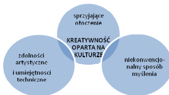
Rys. 1. Czynniki wpływające na poziom kreatywności

Fig. 1. Factors influencing the level of creativity