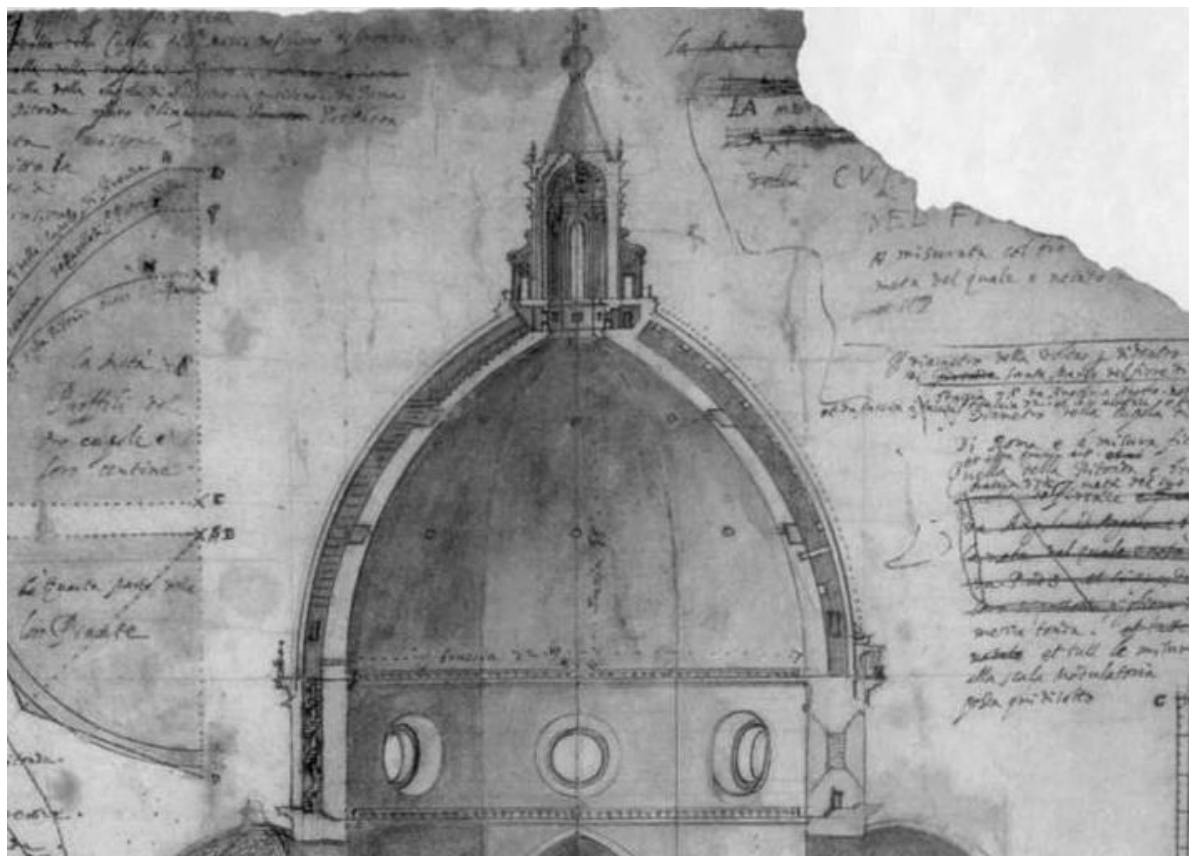
Rys. 2. Fragment rysunku Brunelleschiego przedstawiający kopułę katedry florenckiej [3]